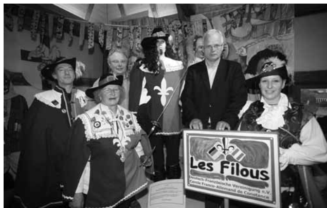
»Filou« im Fasnachts- und Brauchtummuseum im Rheintorturm