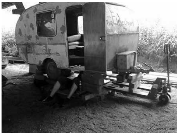
Bau einer Kutsche durch die »Filous«

Spendenkonto: Nr. 065771 - BLZ 69050001 - Sparkasse Bodensee